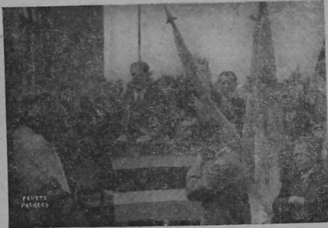
El Ministro de Relaciones Exteriores D. Rafael Castro Quesada pronunciando su discurso.

La feliz idea de la Comisión de Vías Públicas de la Municipalidad capitalina, que motivo esta bella ceremonia interpretada y traducida con fidelidad un sentimiento, común a todos los costarricenses, de cálida simpatía para la Nación Argentina; y, en forma modesta, correspon-